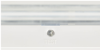
Emergency ExitSign Wireless, test button