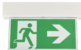
Emergency ExitSign Wireless with spots, front view with arrow legend