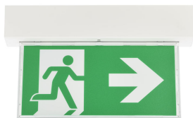
Emergency ExitSign Wireless, front view with arrow legend