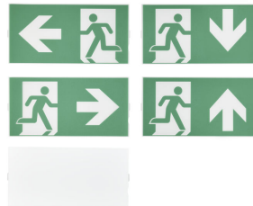
Emergency ExitSign Wireless, set of legends