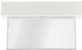
Emergency ExitSign Wireless, front view without legends