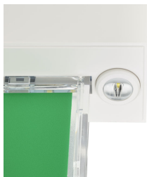
Emergency ExitSign Wireless with spots, spotlight with rotatable lens 2