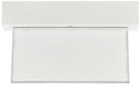
Emergency ExitSign Wireless, front view with blank legend