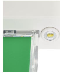
Emergency ExitSign Wireless with spots, spotlight with rotatable lens 1