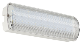
Emergency Bulkhead Wireless, no sticker, lights off