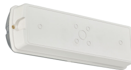
Emergency Bulkhead Wireless, BESA mounting holes on back side