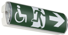
Emergency Bulkhead Wireless, BESA mounting holes on back side