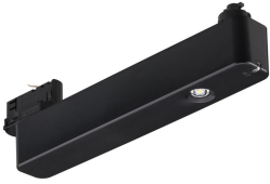
EM160T Emergency Track Spot Black