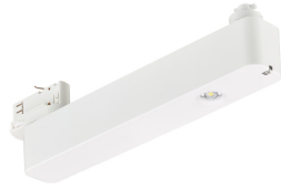
EM160T Emergency Track Spot White