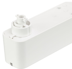
EM160T Emergency Track Spot White