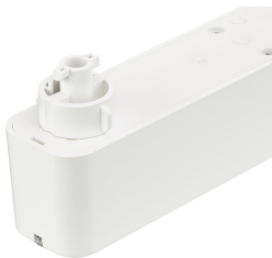
EM160T Emergency Track Spot White