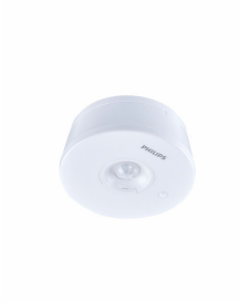
EcoSet parking office wireless sensor std photo