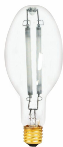
LPPR D-HPS-R 1000W ED37 CL