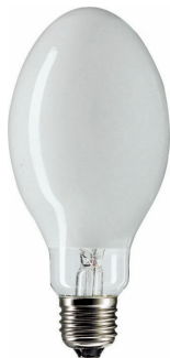
LPPR SON-I CO