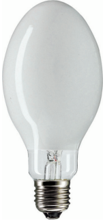
LPPR SON-I CO