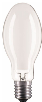
LPPR SON E40 E39