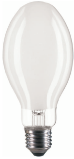
LPPR SON E27 E26