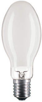
LPPR SON-PIA Plus E40