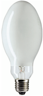
LPPR SON-PIA 0002