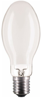
LPPR SON-APIA Plus-Xtra E40