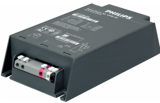
GPPR IPVCP0Xt PHL 0012