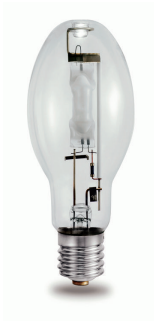
LPPR MH 0002