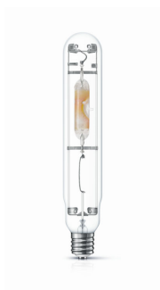
HPI-T 1000W E40