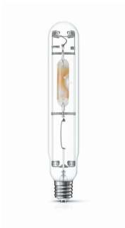
HPI-T 1000W E40