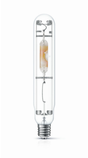
HPI-T 1000W E40