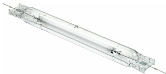
HID-GV III GP-SON