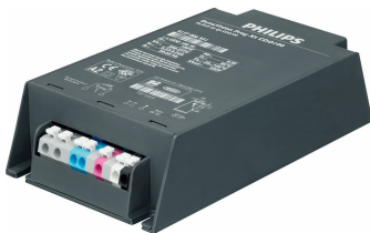
HID-DV DALI Prog Xt 100 CDO Q