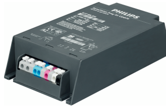
HID-DV DALI Prog Xt 50 & 70 CDO Q