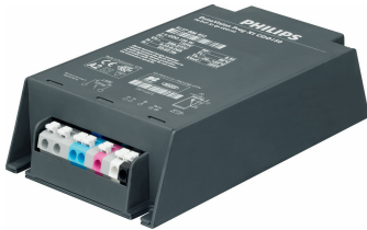
HID-DV DALI Prog Xt 150 CDO Q