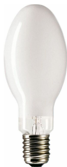
LPPR CDO-ET E40