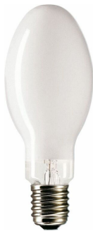
LPPR CDO-ET E40