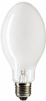
LPPR CDO-ET E27