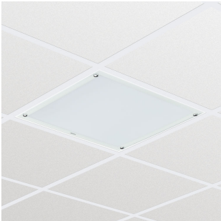
Cleanroom LED-CR250B W60L60