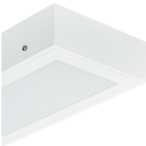
Cleanroom_LED- CR250B_W60L60_CR250Z_SMB- DP14