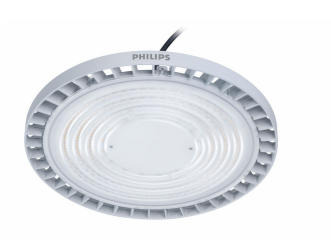
GreenUp Round Highbay