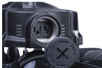
BY240P G2 Selector