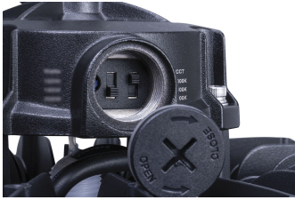
BY240P G2 Selector