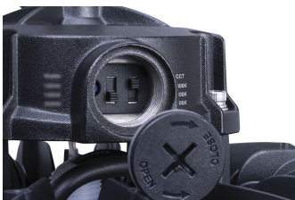
Ledinaire BY030P CCT switch DDP3