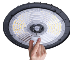
Ledinaire BY030P sensor install DPP