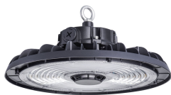
Ledinaire Highbay All-in BY30P