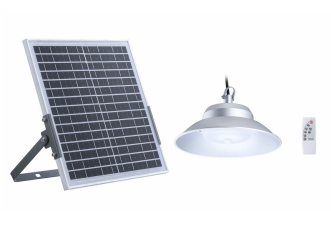
SmartBright Solar Lowbay