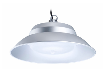
SmartBright Solar Lowbay