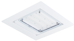
GreenPerform Canopy Mini500 G4