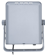
Tango Pro, floodlight