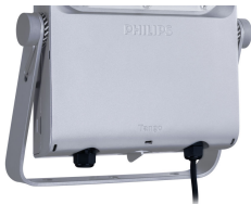
Tango Pro, floodlight