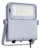
Tango Pro, floodlight