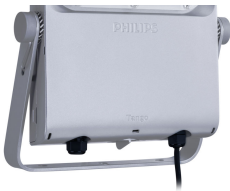
Tango Pro, floodlight