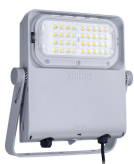
Tango Pro, floodlight