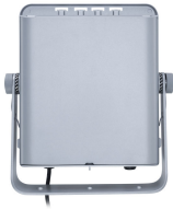
Tango Pro, floodlight