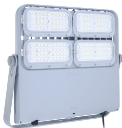
Tango Pro, floodlight