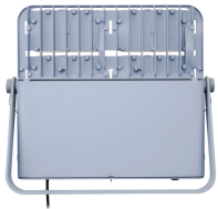
Tango Pro, floodlight