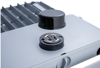
Tango Pro, floodlight