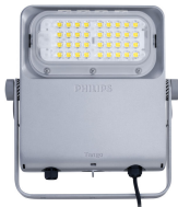
Tango Pro, floodlight