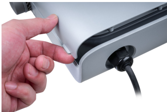
Tango Pro, floodlight