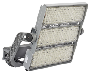
OptiVision LED gen3 5 BVP528 HGB PP