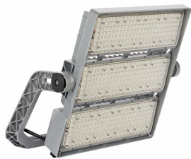
OptiVision gen3.5 3 modules