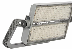
OptiVision gen3.5 2 modules