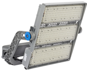
ArenaVision LED gen3 5