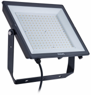
ESSENTIAL SMARTBRIGHT G5 LED FLOODLIGHT