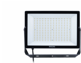
BVP150 front side