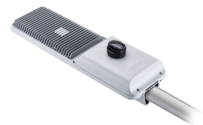
RoadFlair Gen2 BRP49X