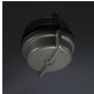
MileWide LED gen2 with bottom sensor