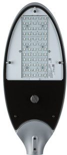
MileWide LED gen2 large with Zhaga socket