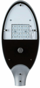
MileWide LED gen2 small with Zhaga socket