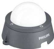
BGS300 G2 CFC