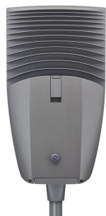
BGP705 Luma gen2 Large top