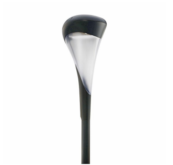
OPPr BDS100i 0003