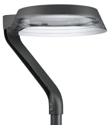
TownTune LYR DR BDP271