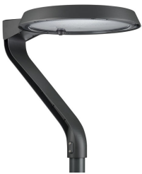
TownTune LYR BDP270