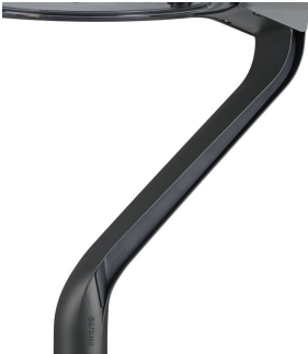
TownTune LYR BDP270