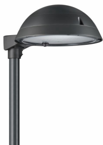
TownTune ASY DTD BDP268