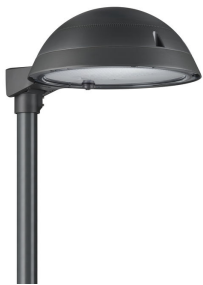
TownTune ASY DTD BDP268