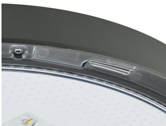
TownTune ASY DR BDP266