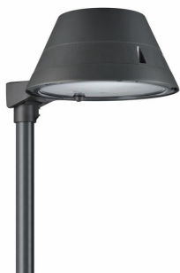
TownTune ASY DTC BDP267