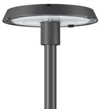
TownTune CPT BDP260