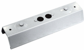
9MX056 CP SI