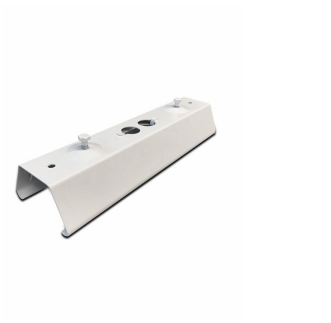
9MX056 CP WH