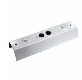
9MX056 CP SI