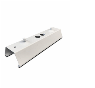
9MX056 CP WH